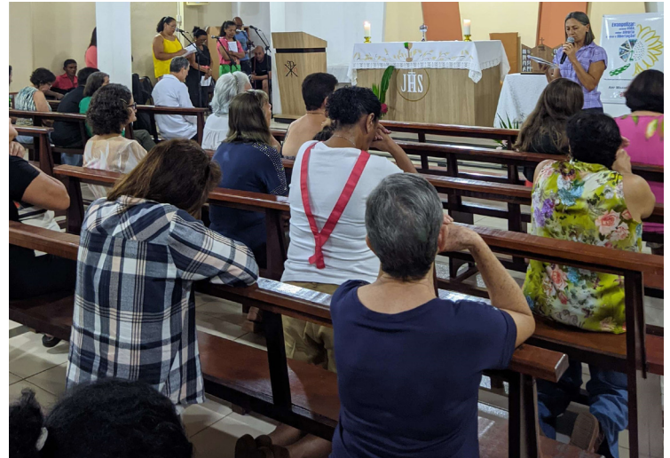
Hora Santa na Comunidade São Sebastião (10/04)