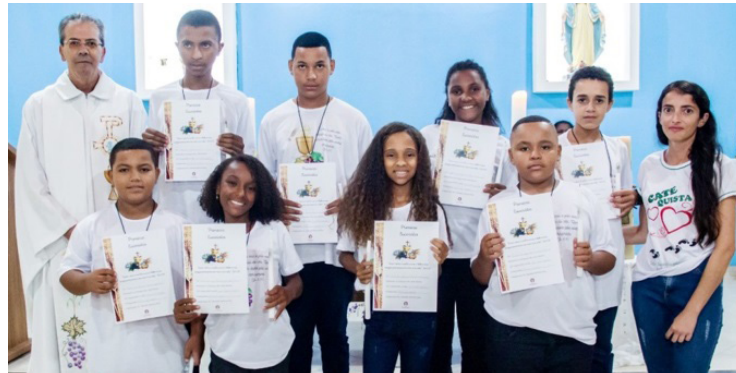
Comunidade Nossa Senhora das Graças (17/04)

Pontuaram que quem comunga deve assumir o