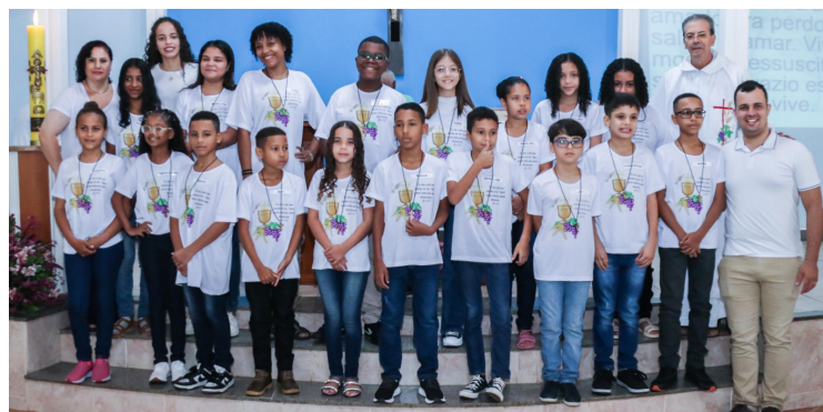
Comunidade Nossa Senhora Aparecida (21/04)