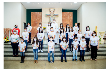
São Sebastião (25/07)