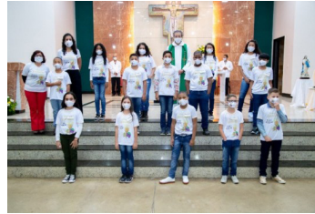
Divino Espírito Santo (10/07)