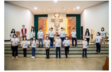
São Judas (04/07)