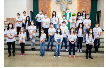
São João Batista (11/07)