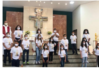
Santa Terezinha (03/07)