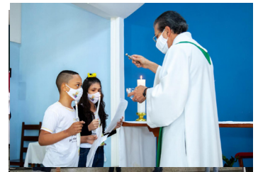
N. Sra. Aparecida (18/07)