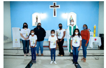
N. Sra. das Graças (21/07)