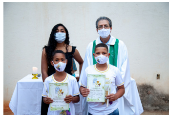
S. Coração de Jesus (18/07)