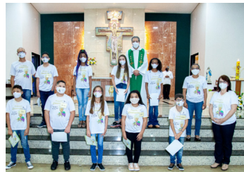
Santa Luzia (17/07)