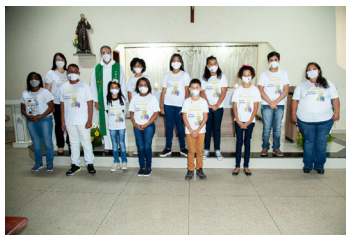
São Francisco (24/07)