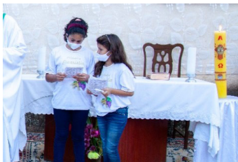
São José (25/07)

PADARIA E MERCEARIA SÃO JOÃO BATISTA PÃES DE FABRICAÇÃO PRÓPRIA Cel: 31 98812 6936 Av. Jacob Lopes de Castro, 338