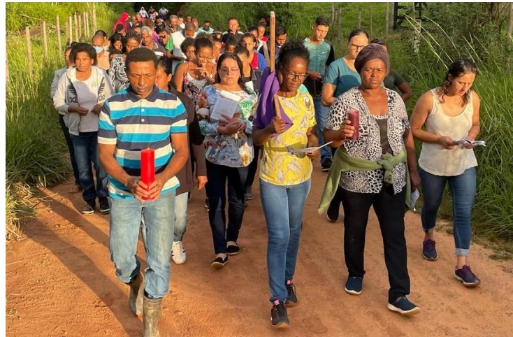
Caminhada penitencial - Comunidade Sagrado Coração de Jesus

Na semana anterior, a paróquia celebrou o Setenário das Dores de Maria. “O Se-