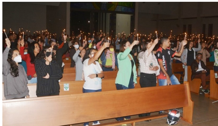
Vigília Pascal - Igreja de São João Batista