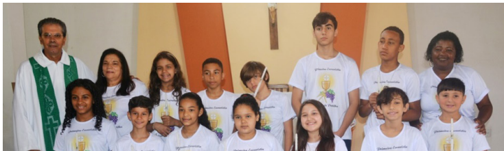
Comunidade de São Sebastião