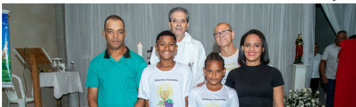
Comunidade de Santa Luzia