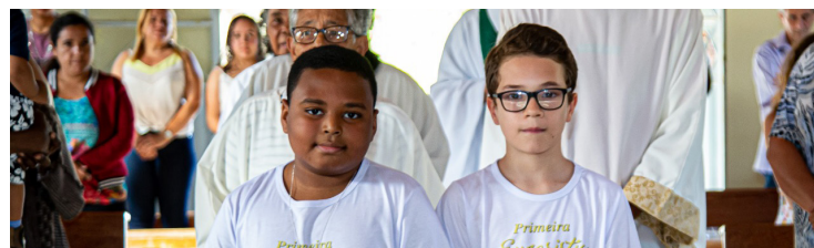
Comunidade de São José