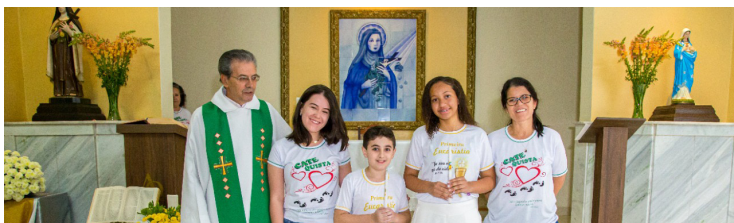
Comunidade de Santa Terezinha