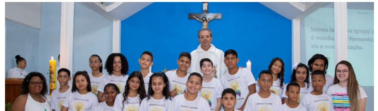
Comunidade de Nossa Senhora Aparecida