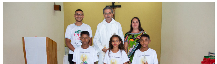
Comunidade do Sagrado Coração de Jesus