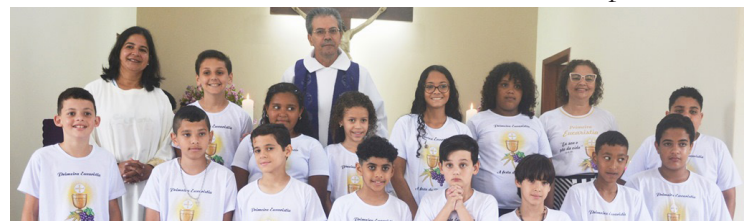
Comunidade de São Judas