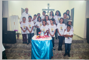
São Geraldo 14/05