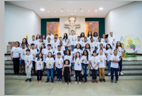
Santa Terezinha 06/05