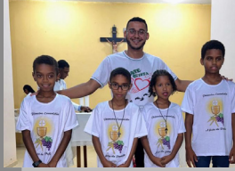
S. Coração de Jesus 23/04