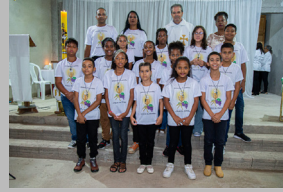
Santa Luzia 15/04