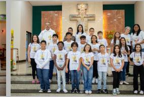
São João Batista 07/05