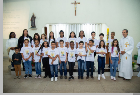
São Francisco 22/04