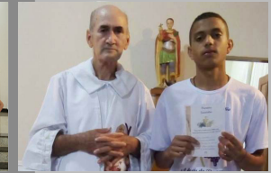
Santo Expedito 07/05

Durante o período pascal, crianças de dez das 14 comunidades da Paróquia São João Batista receberam pela primeira vez o corpo e o sangue de Cristo, nas capelas das comunidades e na Igreja de São João Batista.