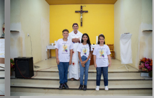
São José 23/04