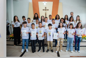
São Sebastião 23/04