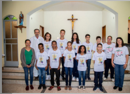
São Pedro 24/05