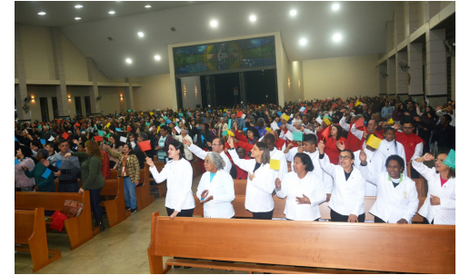
Festa de São João Batista - 24/06

Com o tema “Corações ardentes e pés a caminho, combatendo a fome, fazendo comunhão”, a paróquia São João Batista viveu dez dias de muita alegria durante a celebração da festa de seu padroeiro. A novena começou no dia 15 de junho, culminando com a festa no dia 24.