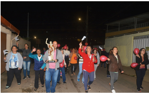
Visita de São João Batista às comunidades -14/06