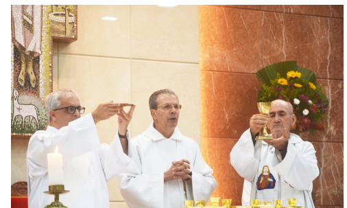
Missa da festa - 24/06