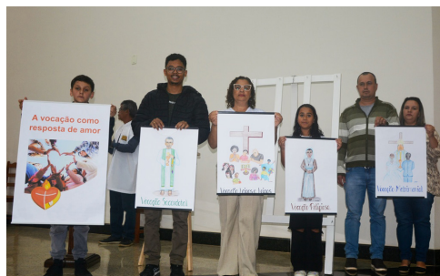
4º Dia da Novena - 18/06