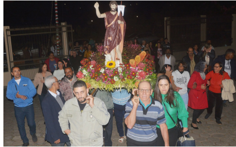
Prociissão - 24/06