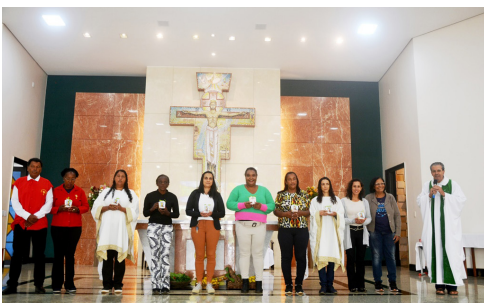
Coord. e representantes das comunidades rurais - 18/06

O presidente da celebração reforçou a importância de todos os cristãos se comprometerem com a dignidade humana, a justiça e o cuidado com a casa comum. “Precisamos deixar o nosso coração arder pela Palavra e colocar nossos pés a caminho para comunicar a alegria da Palavra que liberta e salva”, concluiu.