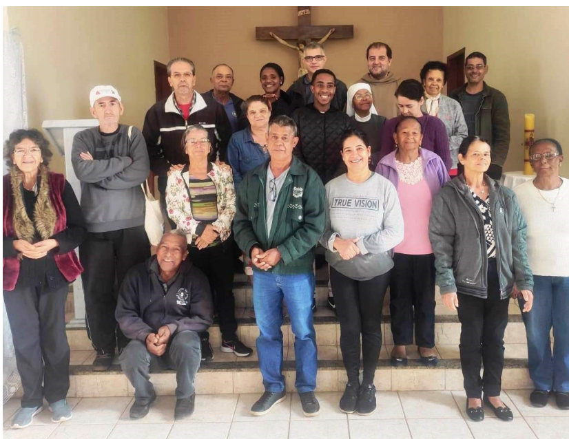
Semana Missionária realizada em maio na Comunidade São Judas Tadeu

O Conselho Paroquial de Pastoral (CPP), reunido no dia 14 de outubro, definiu o tema e o lema do Ano Missionário que a paróquia São João Batista realizará em 2024. Foram escolhidos como tema “Evangelizar: semear vida, colher alegria, celebrar a libertação!” e como lema “Vão, façam que todos se tornem meus discípulos e discípulas” (cf. Mt 28,19).