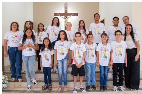
Comunidade São Judas Tadeu (03/05)