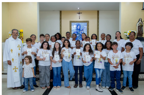
Comunidade Santa Teresinha (02/05)