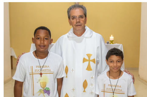
Comunidade Sag. Coração Jesus (17/05)

Vivenciando as alegrias do Tempo Pascal, no mês de maio, 22 crianças da Comunidade Santa Teresinha (Vale do Sol) e duas do Sagrado Coração de Jesus (Pau de Cedro) receberam a Primeira Eucaristia.